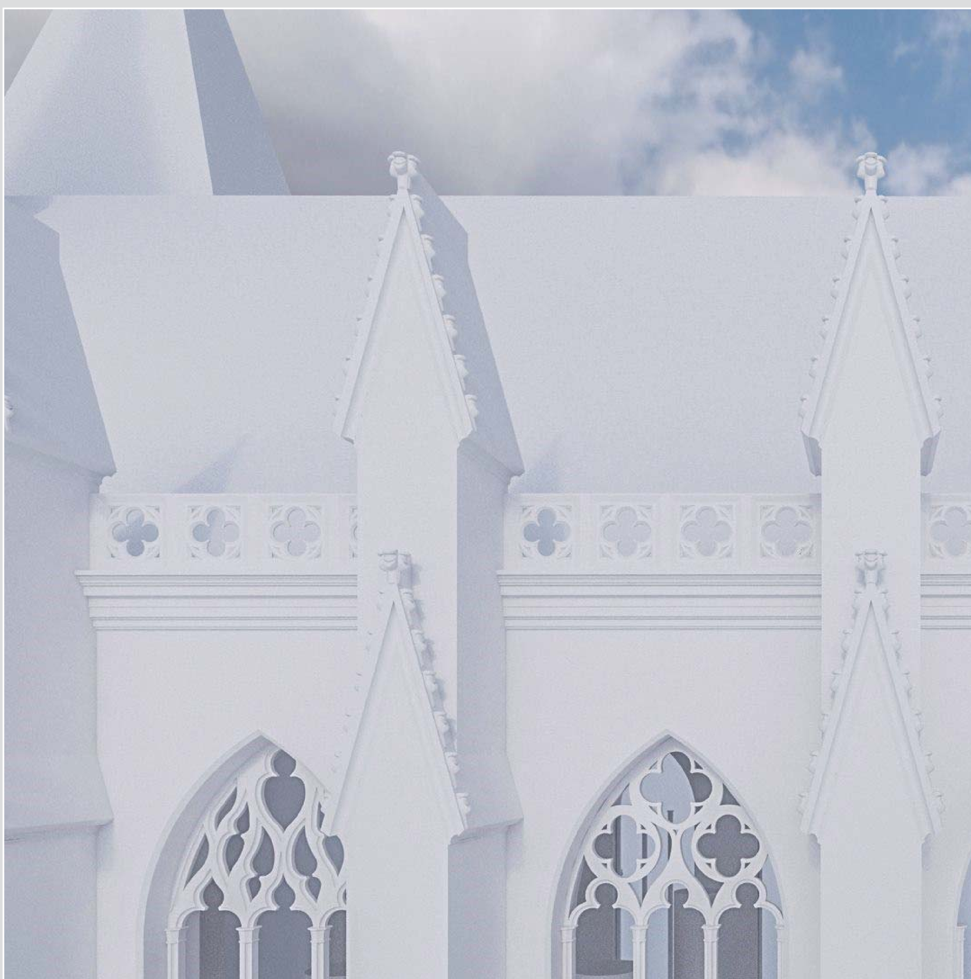
Proposition de restitution de la façade sud de l'église, vue de détail

Elle permet de cerner aussi la chronologie des destructions et touche, à ce titre, le domaine de la conservation patrimoniale.