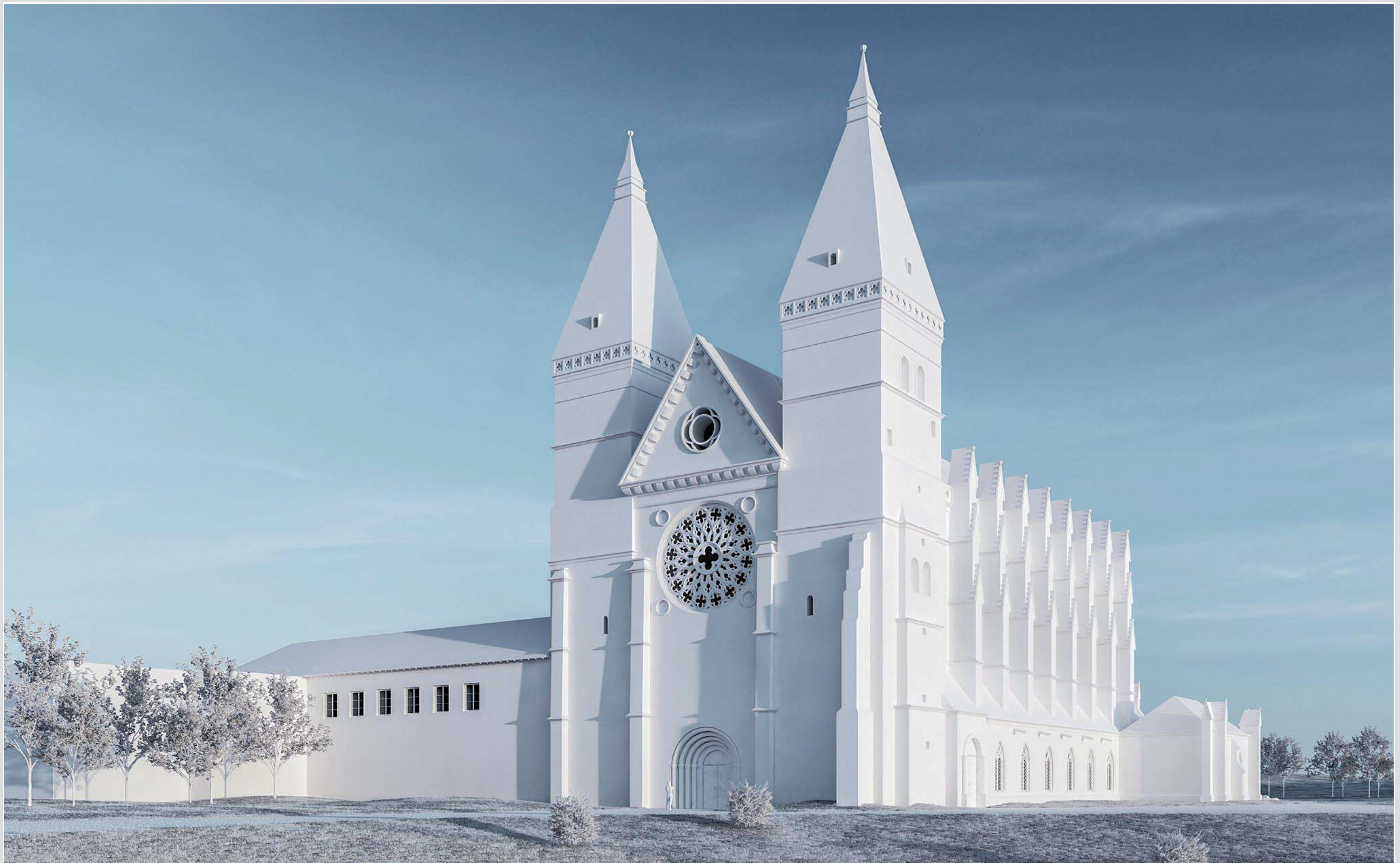
Proposition de restitution de l'église abbatiale gothique, vue depuis le sud-ouest (maquette numérique, © N. Mangeot, 2019)

Cette exposition permet de rendre lisible l'avancement des recherches sur le terrain et de donner les clés de compréhension du passé de l'abbaye. Les restitutions ont nécessité une collaboration étroite avec un architecte, Nicolas Mangeot.